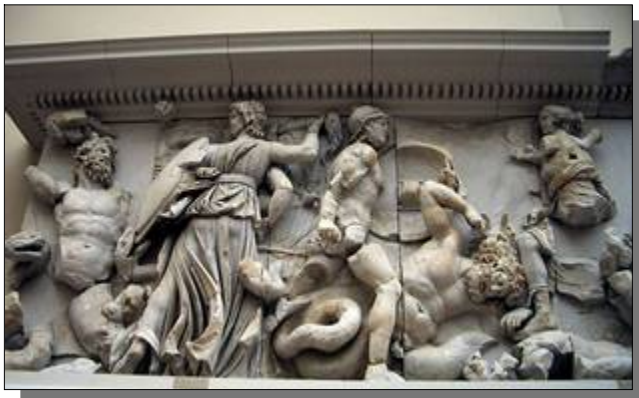
Ausschnitt aus dem sog. Gigantenfries des Pergamonaltars