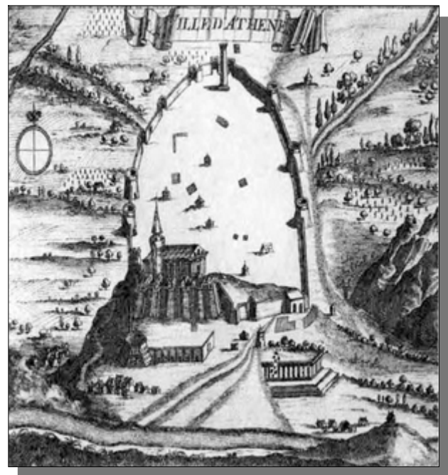
Spätmittelalterlicher Stadtplan von Athen mit Marien-Kirche, die zuvor ein heidnischer Tempel gewesen sein soll.