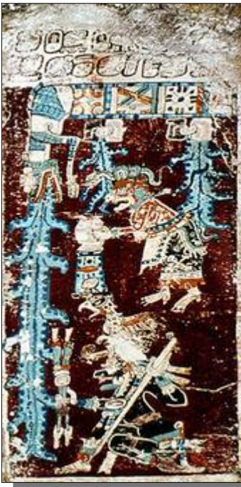
Die (Maya-)Welt wird von einem Krokodilmonster verschlungen